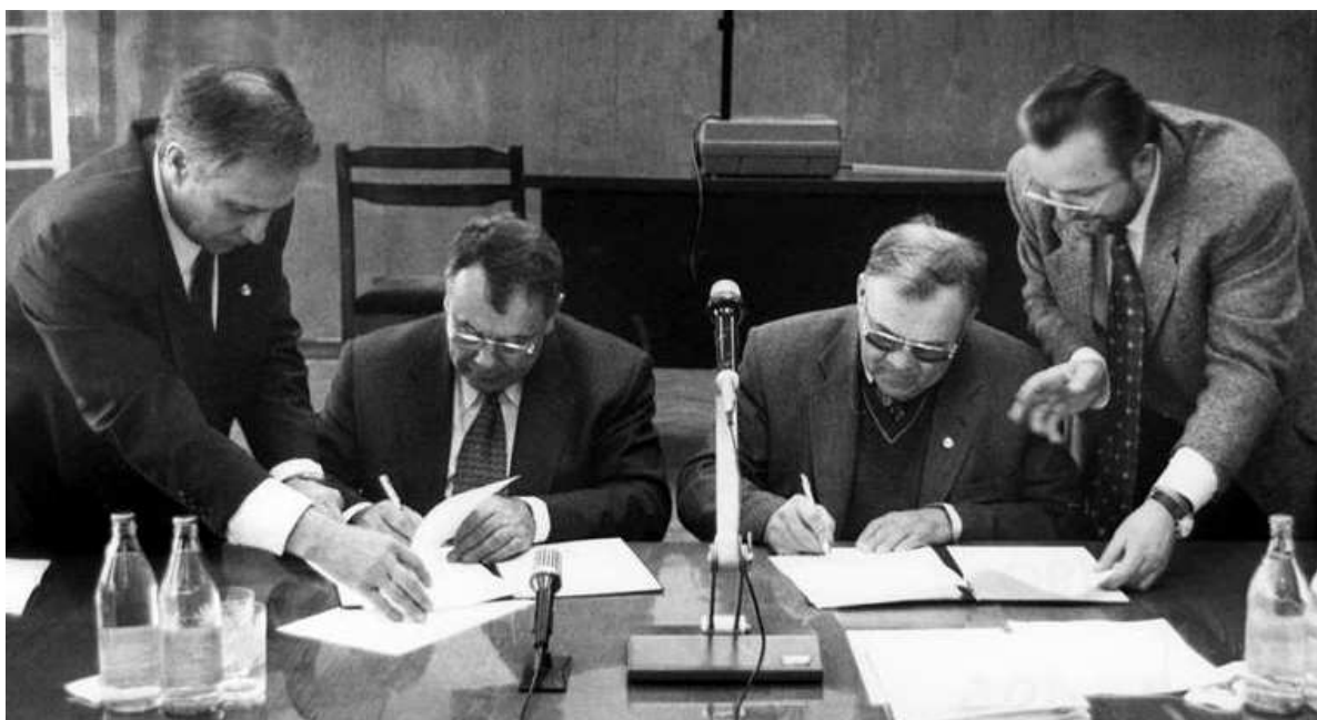
Глава администрации Новосибирской области В.П. Муха и академик Н.Л. Добрецов подписывают документы. 1999 год