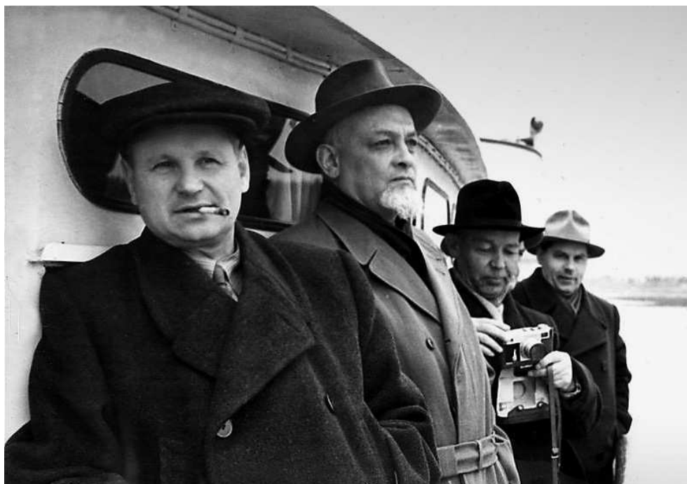
Академик С.А. Христианович (слева), академик Н.Н. Ворожцов