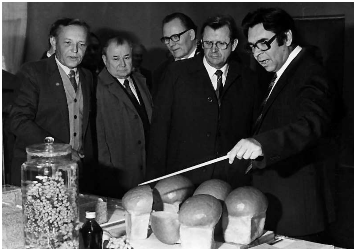
Слева направо: академик В.А. Коптюг, председатель Новосибирского облисполкома В.А. Филатов, председатель Новосибирского горисполкома И.П. Севастьянов, член Политбюро ЦК КПСС В.И. Воротников, член-корреспондент СО АН СССР В.К. Шумный (впоследствии академик). Начало 1980-х годов