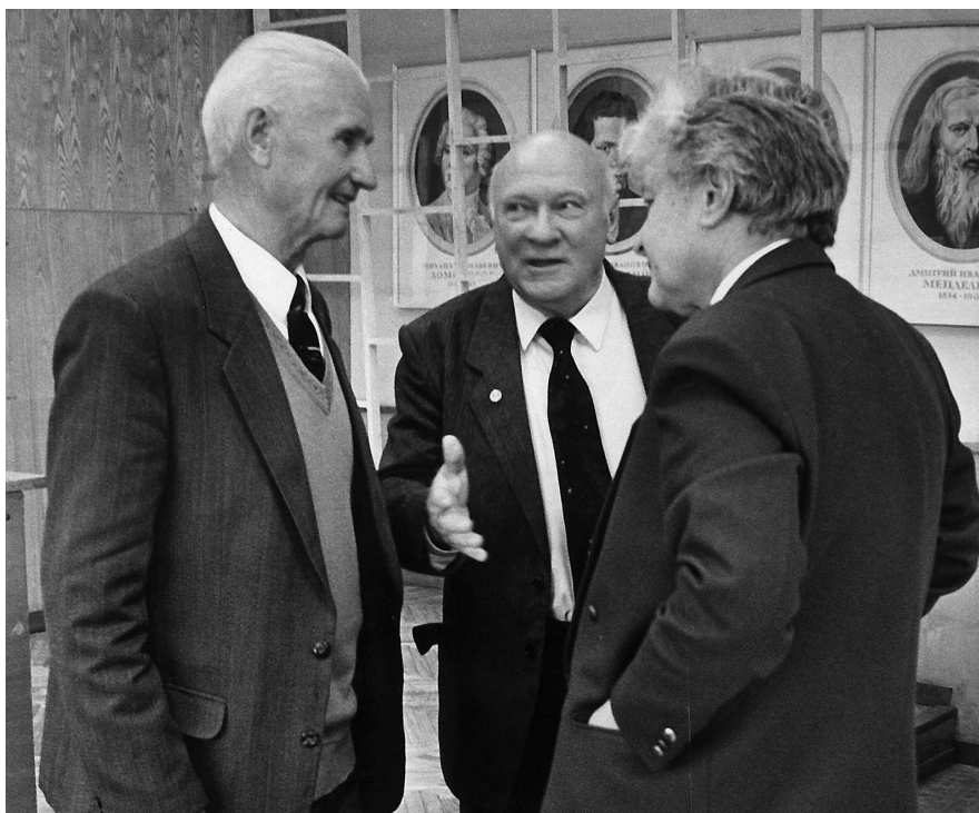
Слева направо: директор Института оптики и атмосферы (Томск, 1969–1997) академик В.Е. Зуев, директор Института угля и углекислоты СО РАН (Кемерово, 1983–2002) член-корреспондент АН СССР Г.И. Грицко, директор Института органической химии СО РАН (1977–2002) академик Г.А. Толстиков