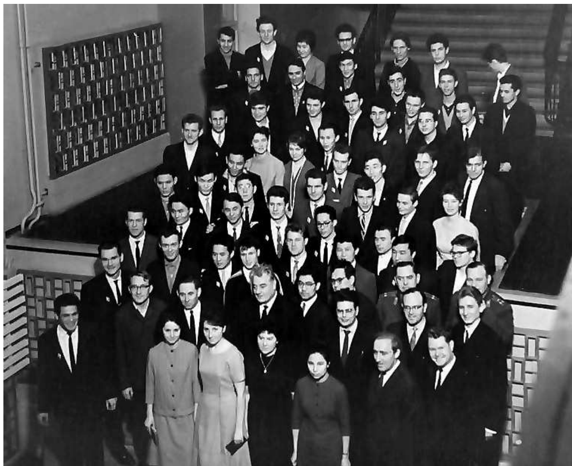
Академик Н.И. Векуа среди первых выпускников НГУ