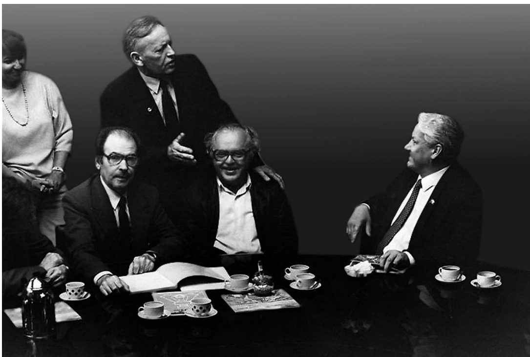
Приезд в Новосибирский академгородок Президента Российской Федерации Б.Н. Ельцина. 2 июля 1991 года