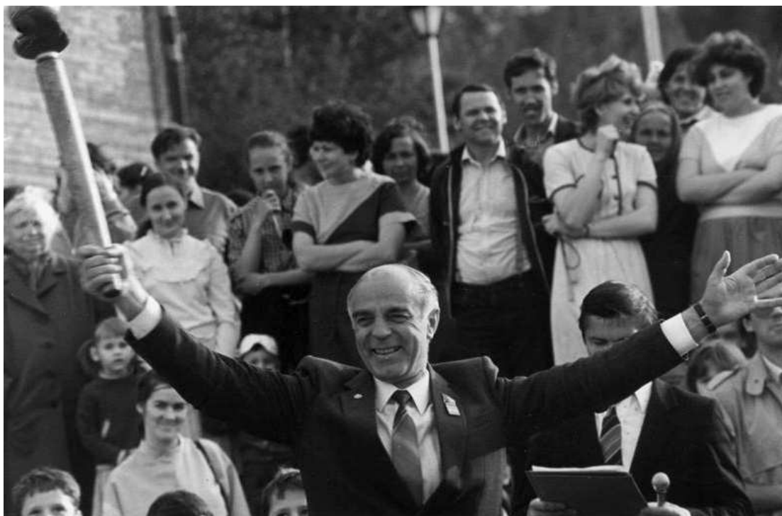
Академик Н.А. Логачев на празднике в Иркутском академгородке, посвященном 300-летию города