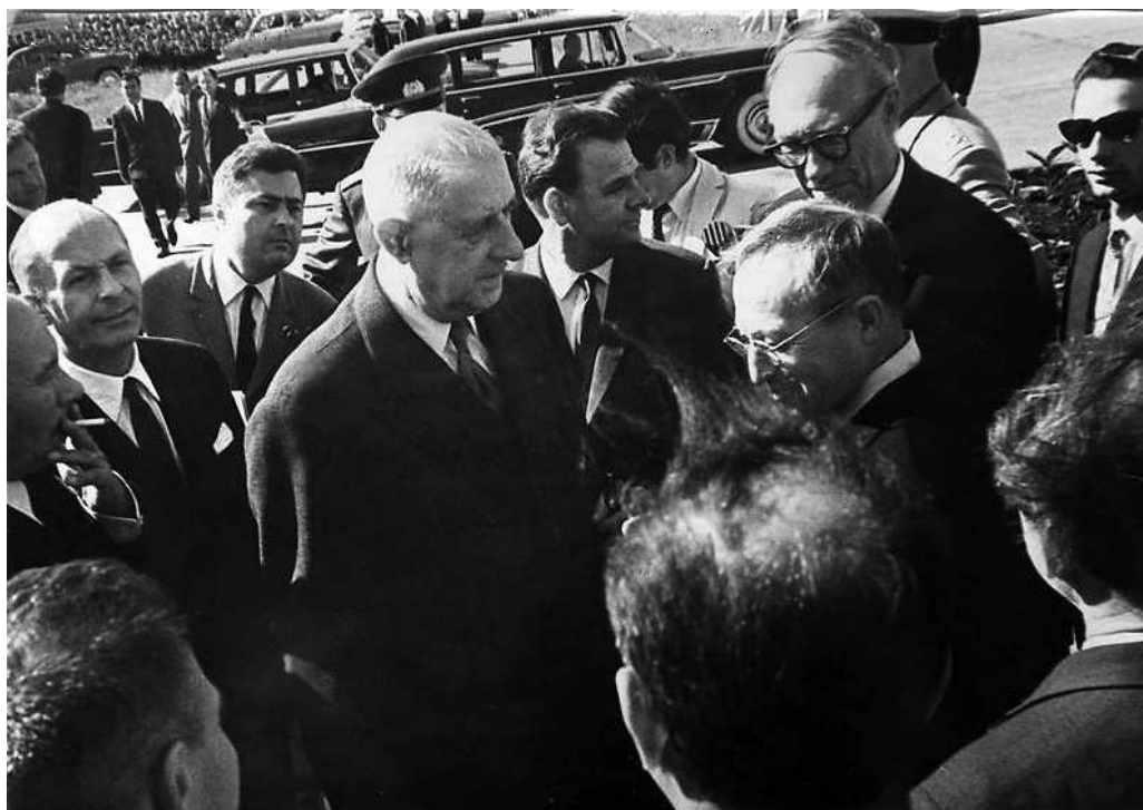
Шарль де Голль и сопровождающие лица. 24 июня 1966 года