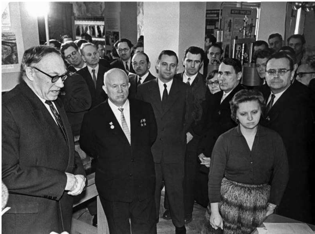
Академик М.А. Лаврентьев и Н.С. Хрущев в Институте геологии и геофизики СО АН СССР. 1961 год