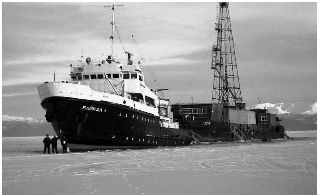
Проект «Байкал – Бурение». Буровой комплекс в точке бурения