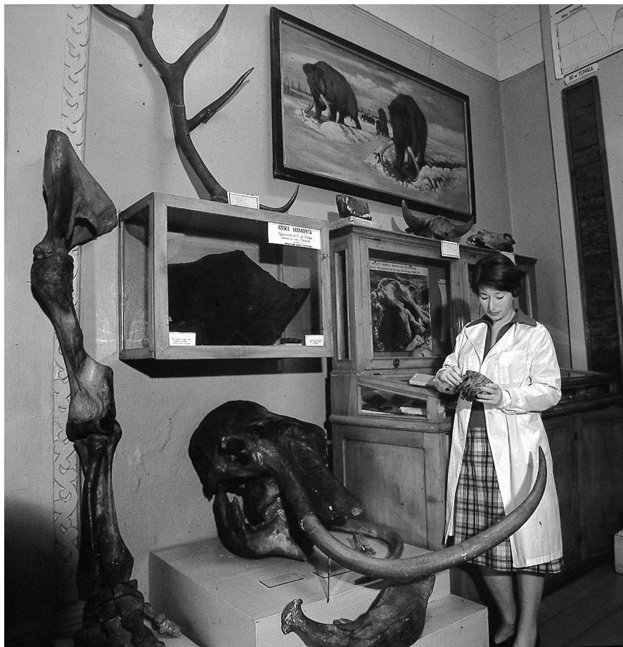
Стенд Якутского музея ЯНЦ СО РАН