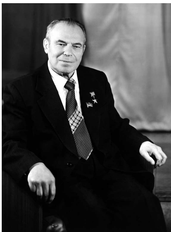
Академик А.А. Трофимук